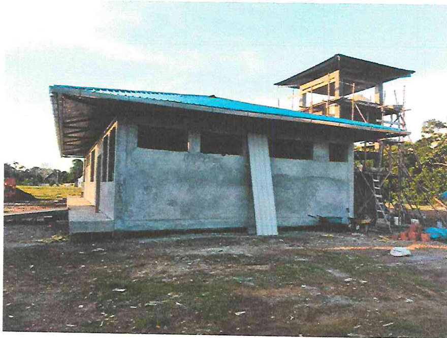
Fotografía N° 15.- Vista panorámica lateral del Centro de Salud.