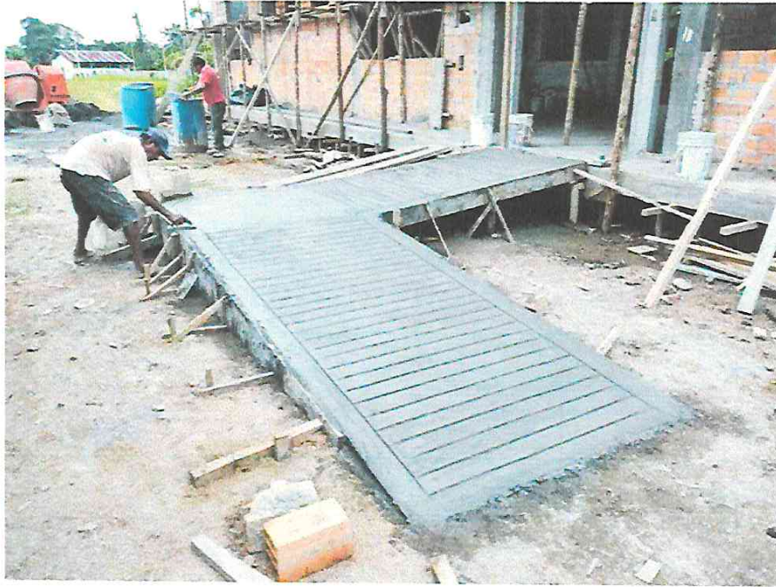
Fotografía N° 05.- Vista de los trabajos de bruñado en la rampa.