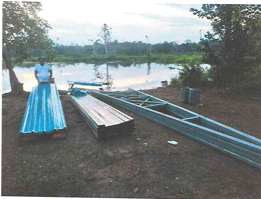
Fotografía N° 02.- Se observa los materiales que se utilizarán en la cobertura de la edificación.