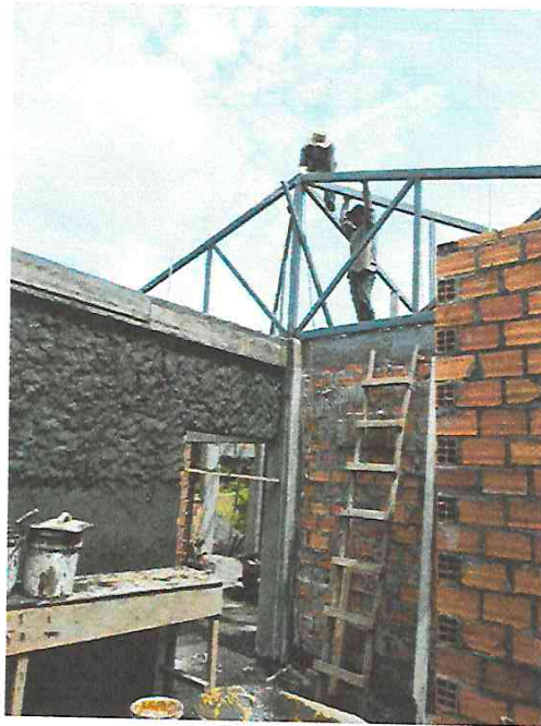
Fotografía N° 07.- Trabajos de tarrajeo en el interior de los módulos.