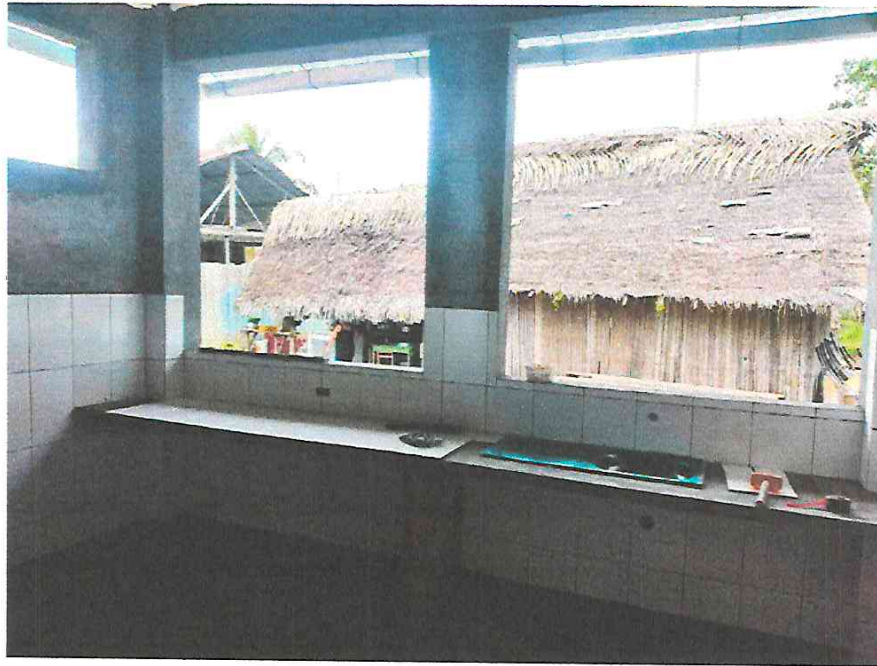
Fotografía N° 13.- Instalación de lavatorios e la cocina.