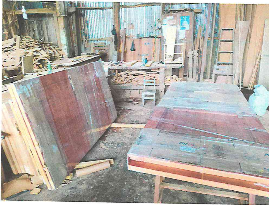
Fotografía N° 03.- En la toma las puertas de madera que se utilizaran en la Edificación.