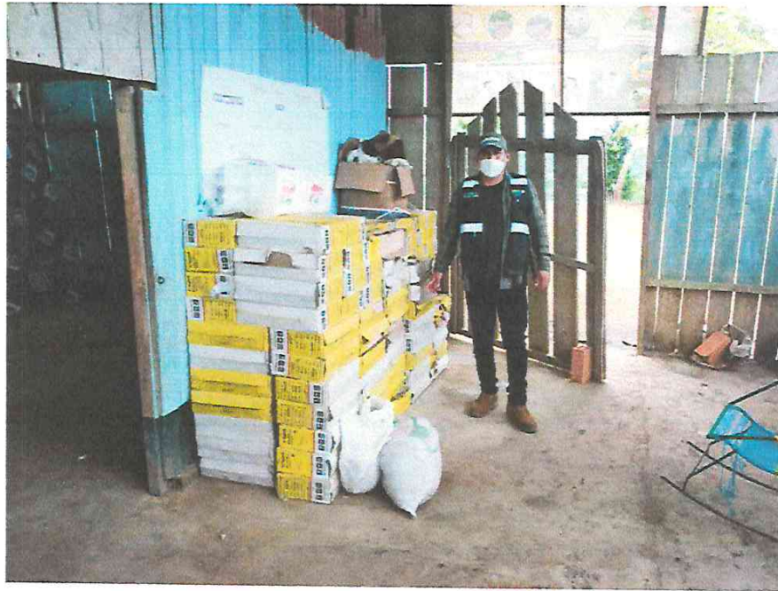
Fotografía N° 01.- Inspector de Obra verificando los materiales (cerámico) que se utilizaran en los pisos del centro de salud.