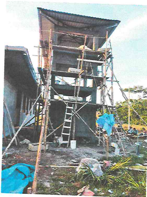
Fotografía N° 10.- Trabajos de instalaciones sanitarias en el tanque elevado