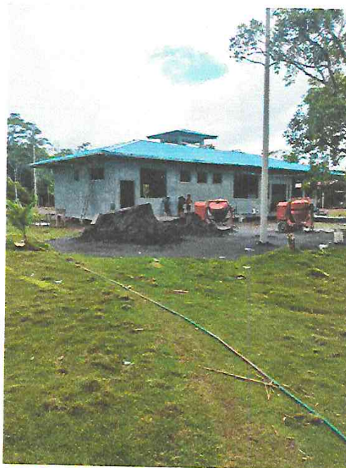
Fotografía N° 16.- Vista panorámica del Centro de Salud.