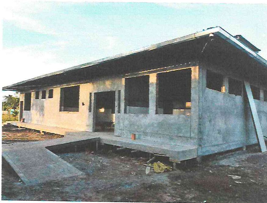
Fotografía N° 14.- Instalación de canaletas pluviales.