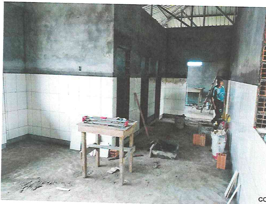
Fotografía N° 08.- Trabajos de colocación de zócalo con mayólica.