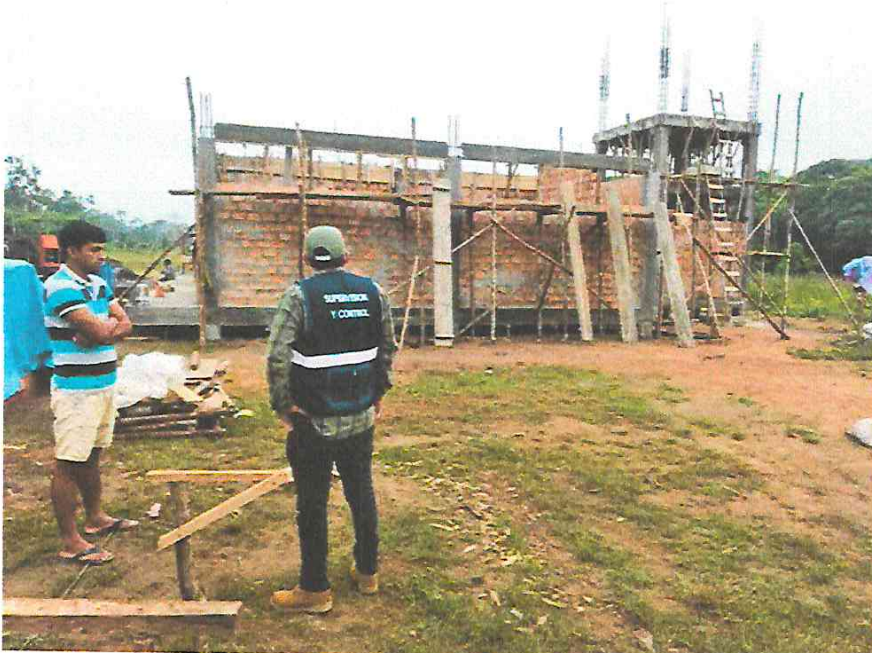
Fotografía N° 06.- Inspector de obra Verificando los trabajos insitu.