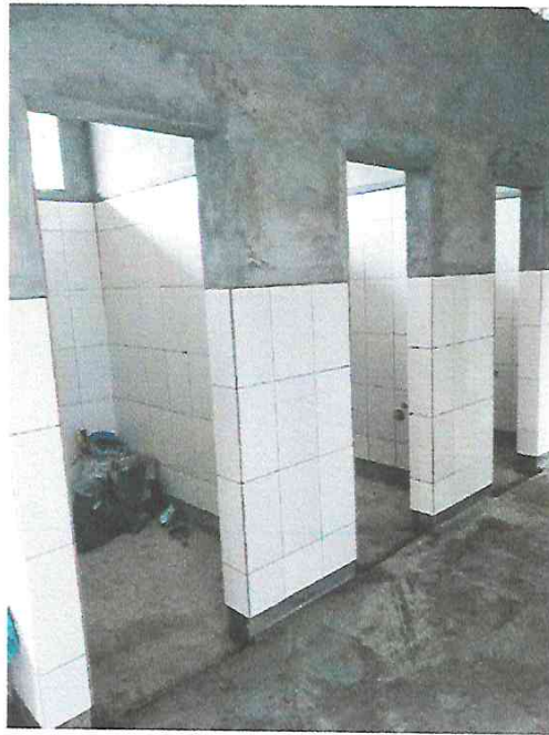
Fotografía N° 11.- vista de los trabajos enchapado en los Servicios Higiénicos.