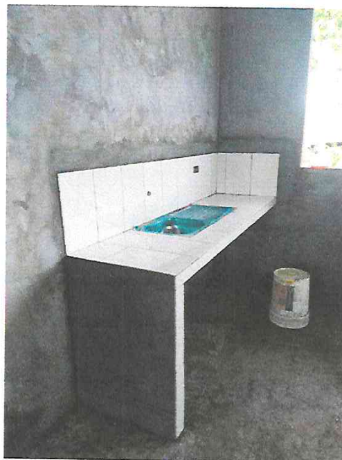
Fotografía N° 12.- Colocación de lavatorio en el área de tópico.